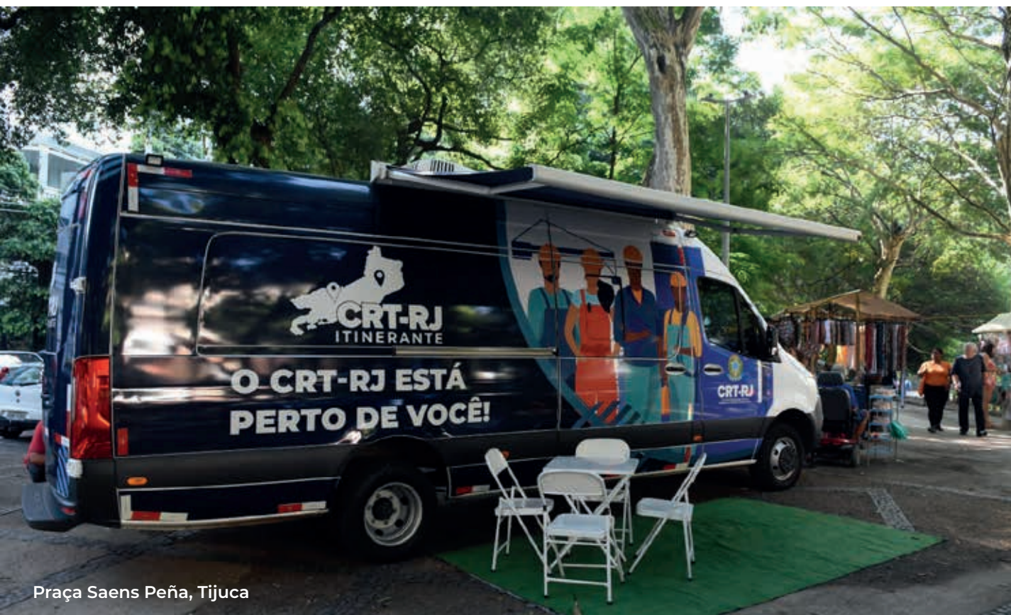
Praça Saens Peña, Tijuca

O programa CRT Estágios tem proporcionado experiências enriquecedoras para estudantes de cursos técnicos, permitindo-lhes aplicar seus conhecimentos na prática e desenvolver habilidades essenciais para sua futura carreira profissional.