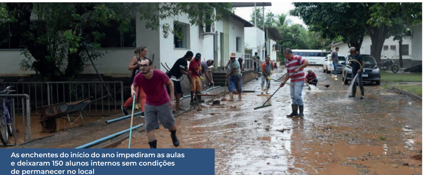
As enchentes do início do ano impediram as aulas e deixaram 150 alunos internos sem condições de permanecer no local