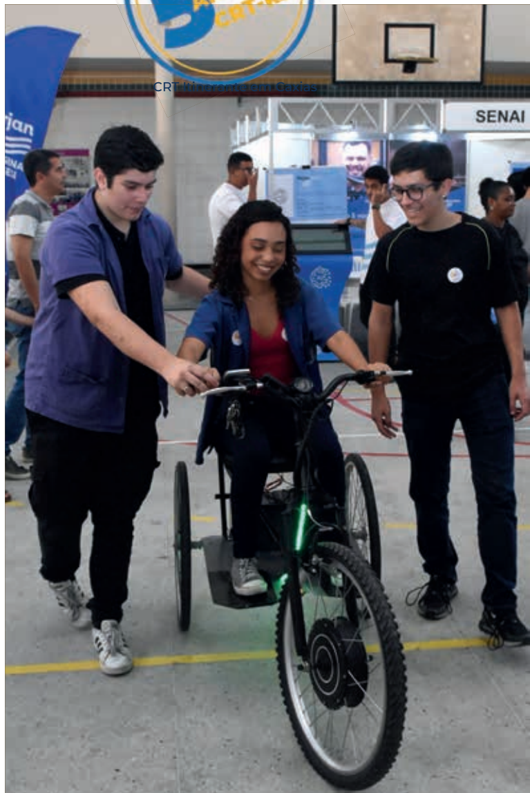
Feira de Ciências na I Semana Estadual do Técnico Industrial