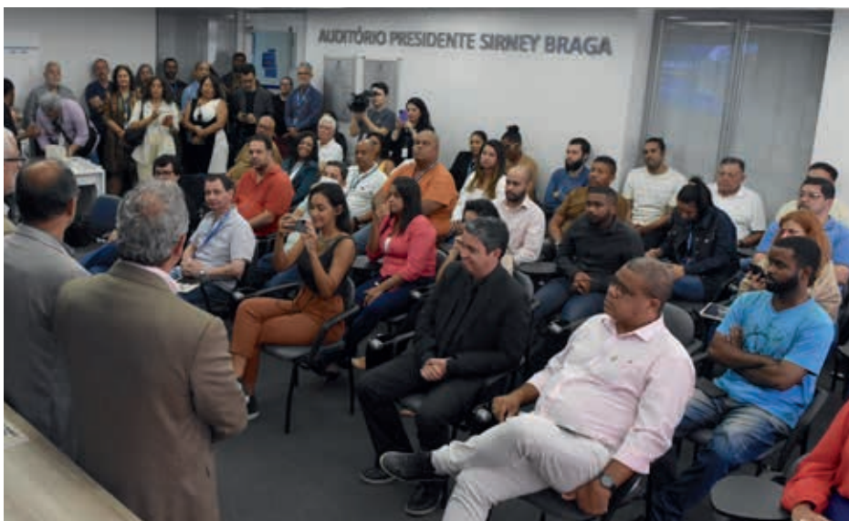
A cerimônia de assinatura do Termo de Cooperação no auditório do CRT-RJ