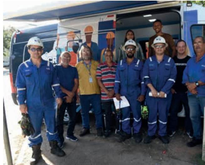
CRT Itinerante em Macaé e Campos