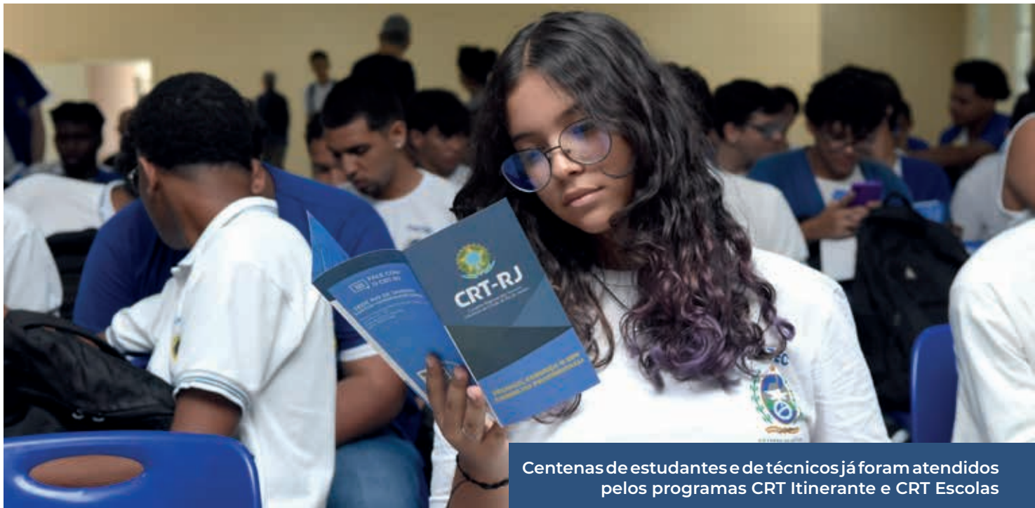
Centenas de estudantes e de técnicos já foram atendidos pelos programas CRT Itinerante e CRT Escolas