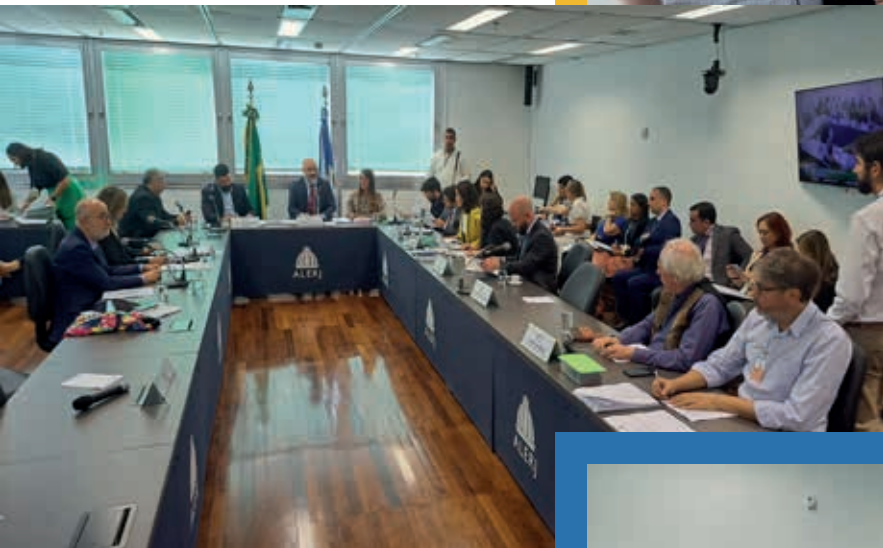
Reunião da Comissão de Constituição e Justiça da Alerj debate as emendas ao PL 1556/2019