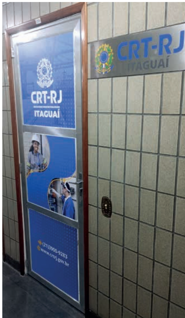
O Escritório funciona na Avenida Paulo de Frontin, 61, 2º andar, Calçadão de Itaguaí.