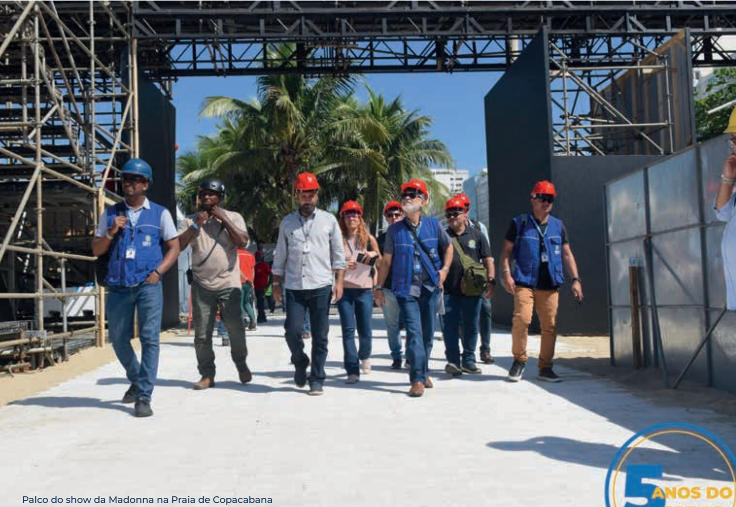
Palco do show da Madonna na Praia de Copacabana